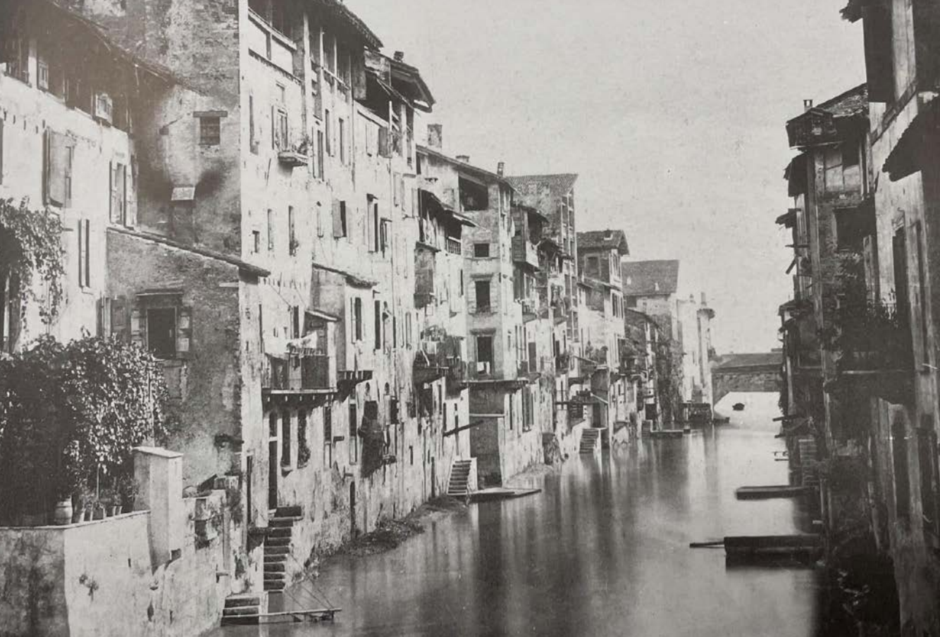
In alto: Il Canale dell'Acqua Morta a valle del ponte di San Vitale di Giorgio Sommer (1875), da Milani G., La Verona fluviale , p. 57