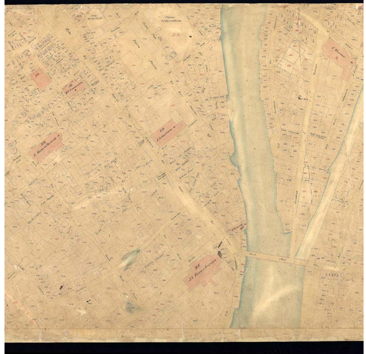
Foglio 10 (a sinistra) e foglio 16 (a destra) del Catasto austriaco post-rettifica del 1853