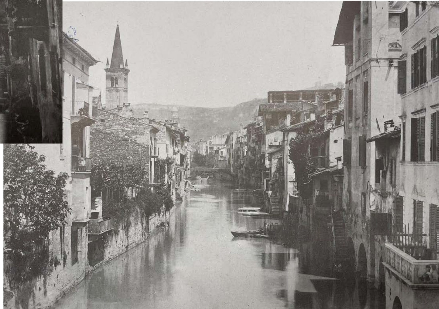
In basso: Il ponte dell'Acqua Morta visto da ponte Navi, BCVR, Raccolta di fotografie (da Una città e il suo fiume , p. 833)